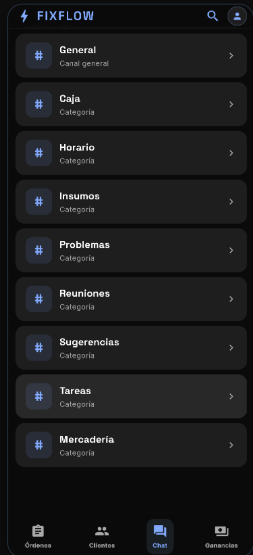
Lista de categorías del chat

Para abrir una conversación, tocá la categoría. Desde ahí podés escribir mensajes, recibir avisos y ver quién escribió cada cosa.